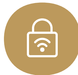
Indbygget sikkerhedspakke til pc, tablet og mobil

6 mdr. binding. Priser v/Automatisk Kortbetaling (ellers tillæg på 49 kr. pr. regning eller 9,75 kr. pr. regning v/BS). Oprettelse 299 kr. Forsendelse 99 kr. Se mere på yousee.dk/bredbaandsfakta . *Der er 6 mdr. binding på abonnementet, derefter er prisen 249 kr./md. Det betyder en mindstepris på 1.194 kr. Tilbuddet gælder for nye bredbåndskunder.