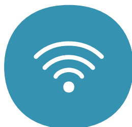
Inkluderet trådløs router med god wi-fi dækning